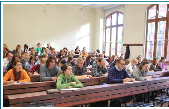
Studierende während einer Vorlesung

Bevor wieder Studenten die Vorlesungsräume im Hörsaalgebäude am Historischen Campus in der Domstraße, dem sogenannten Audimax, bevölkern, gibt es ein vielfältiges Vorlesungsprogramm für die Greifswalder und ihre Gäste, Erstsemesterstudenten und ihre Eltern sowie für Mitarbeiter und Angehörige der Universität, kurz: für jedermann. Die Vorlesungen dauern bis auf eine Ausnahme jeweils 45 Minuten. Sie finden in der Zeit von 13:00 bis 18:00 Uhr statt.