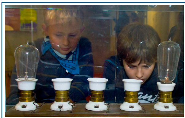
Physik ist spannend

Bei Mitmachexperimenten kann man sich davon überzeugen, dass Physik spannend ist. In einem anderen Hörsaal geht es um die Frage, warum Frauen zu Kindsmörderinnen werden und um die Überwindung der eigenen Angst. Archäologen berichten, wie sie den sensationellen Silberschatz von Anklam gefunden haben und welche Schlacht vor einigen tausend Jahren im Tollensetal tobte. Wer wissen möchte, womit sich die Rechtsmediziner beschäftigen oder welche Gewalterfahrungen Jugendliche in Vorpommern haben, wird im Vorlesungsverzeichnis des Tages der Wissenschaft ebenso fündig, wie der besorgte Bürger, der sich die Frage stellt, ob der Euro gefährdet ist. Weitere Themen sind der Klimawandel im hohen Norden und die Gletscher, die uns Geschichten über unsere Landschaft erzählen.