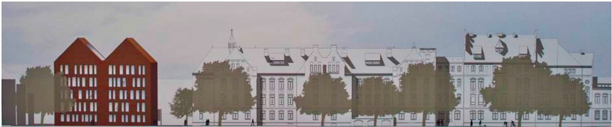
Entwurfsansicht Ryckseite. Links ist der Neubau der Bereichsbibliothek zu sehen.

den teilweise noch genutzten Klinikgebäuden für die geisteswissenschaftlichen Bereiche der Universität verteilt; nur geholfen hat es beispielsweise denen, die im Gebäude der Anglistik in der Steinbeckerstraße lehren und studieren müssen, bisher nichts.