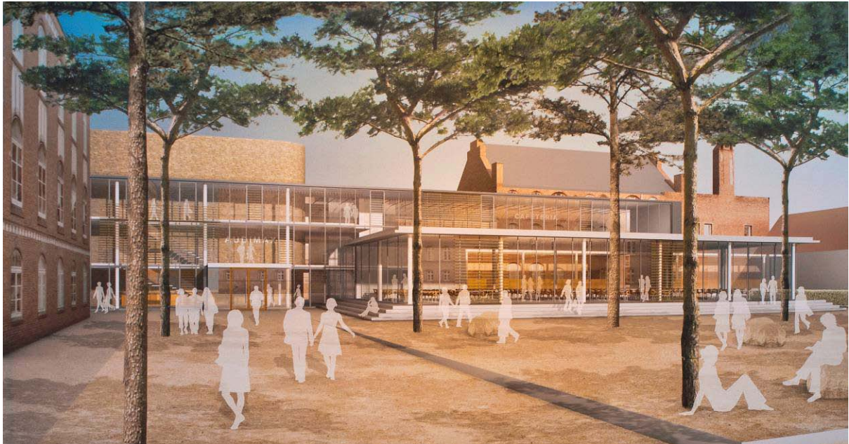
So soll der Innenhof am Campus Loefflerstraße aussehen.