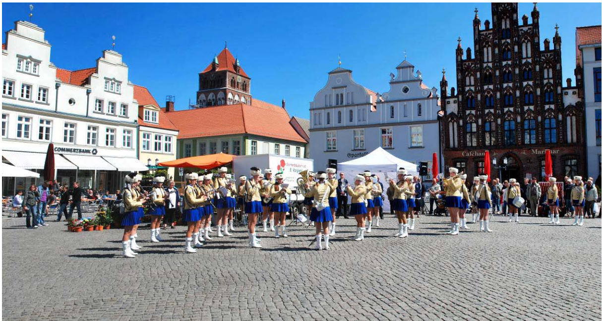
Die 50-köpfige dänische Mädchen-Marching-Band Gladsaxe Pige garde auf dem Greifswalder Markt 1

Der Nordische Klang, der vom gleichnamigen Verein in Zusammenarbeit mit der Nordischen Abteilung der Universität organisiert wird, war dank einer Kooperation mit dem Verein Greifswalder Innenstadt besonders gut im Stadtbild sichtbar. Anlässlich eines einkaufsoffenen Sonntags spielte die 50-köpfige dänische Mädchen-Marching-Band Gladsaxe Pige garde Konzerte auf dem Marktplatz und zog durch die Straßen der Innenstadt. Eine weitere Innovation war eine Wanderlesung auf dem Wall, die sich dem isländischen Autor Gyrdir Eliasson widmete, und eine schwedische Kurzfilmmacht, mit der die Greifswalder Kurzfilmmacht-Initiative kufina sich einbrachte.