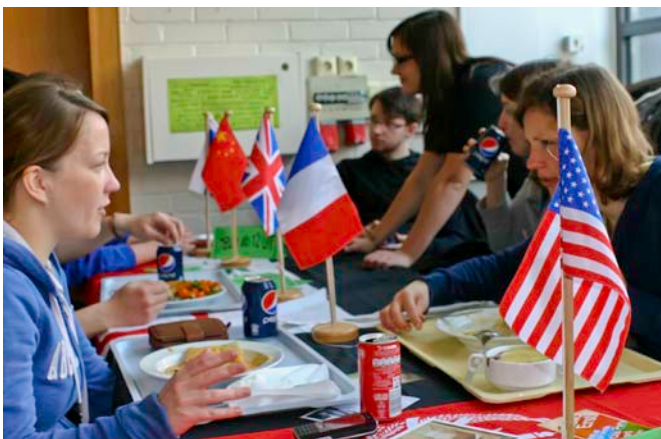
Greifswalder und Austauschstudenten beim ersten Sprachstammtisch in der Mensa.