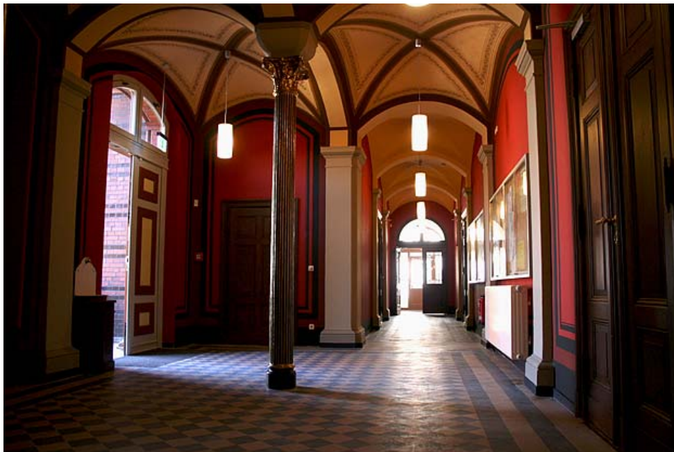
Das sanierte Foyer im Audimax