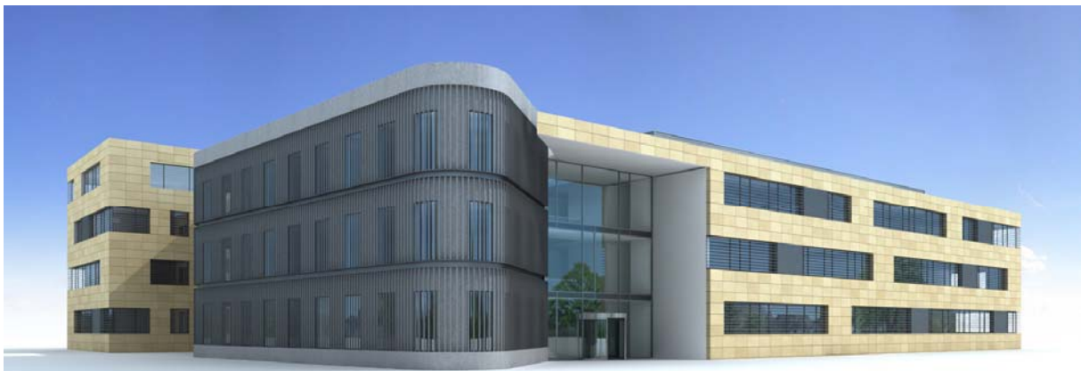
Hochschulbau von nationaler Bedeutung – Der Pharmazieneubau C_DAT

Das allein wird jedoch nicht reichen. Entscheidend ist, dass wir exzellent in der Forschung sind, auch wenn es keine explizite Exzellenzförderung gibt. Die Universität ist auf einem guten Weg. Im vergangenen Jahr konnten Drittmittel in Höhe von rund 30 Millionen Euro ausgegeben werden.