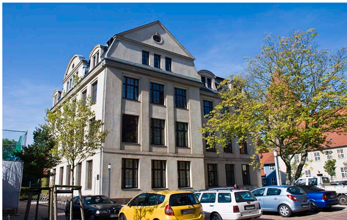
Das Historische Institut in der Domstraße

Und die Schließung des Historischen Instituts in der Domstraße kam wie ein Paukenschlag. Ende September fiel in der Fachbibliothek ein großes Stück Putz von der Decke. Nach Sperrung der Bibliothek und statischen Untersuchungen musste das Gebäude aus Sicherheitsgründen gesperrt werden. Derzeit wird geklärt, wie das Gebäude und in welchem Zeitraum das Gebäude saniert werden kann.