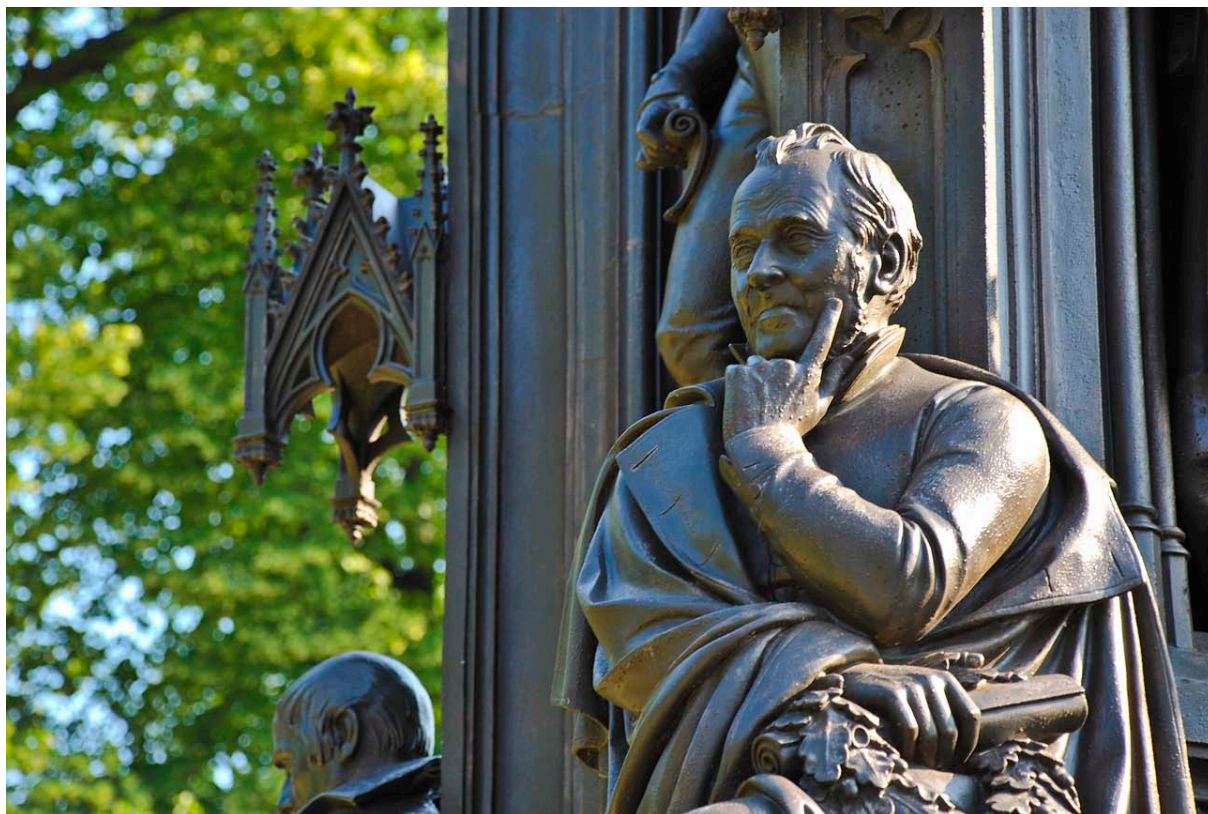
Arndt auf dem Rubenowdenkmal vor dem Universitätshauptgebäude

Im Januar 2010 folgte eine zweite, diesmal öffentliche Anhörung. Es ging um die Frage: Welche außerwissenschaftlichen Gesichtspunkte (zum Beispiel städtische, regionale, nationale, internationale) sprechen für oder gegen die Beibehaltung des Namens Ernst Moritz Arndt? Die Diskussion im St. Spiritus war emotional geprägt. Einige Diskussionsteilnehmer verwiesen darauf, dass sie zu Beginn der neunziger Jahre, unmittelbar nach Wende und deutscher Einheit, gerade auch mit dem Namen Ernst Moritz Arndt für den Erhalt der Universität gekämpft haben. Andere artikulierten sehr deutlich das Gefühl, dass ihnen etwas weggenommen werden soll.