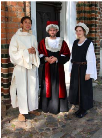
Historische Figuren führen durch die Unigeschichte

Wer sich schon immer gefragt hat, wie die Menschen in und um unsere Universität vor 500 Jahren gelebt haben, kann dies nun in einer Führung zu den mittelalterlichen Wurzeln der Universität Greifswald hautnah erleben. Die Kustodie der Universität bietet seit diesem Sommer die neue Spezialführung Auf der Route der europäischen Backsteingotik – die Universität Greifswald und St. Nikolai im Spätmittelalter an. Sie führt in die Zeit der Universitätsgründung vor 554 Jahren und lässt die historische Person des Unigründers Heinrich Rubenow und zwei weitere fiktive Charaktere „auferstehen“, um dem Publikum spannende Geschichten aus ihrem Leben zu erzählen.