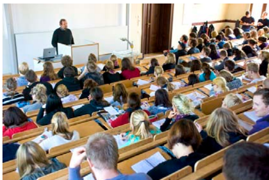
Einführungsvorlesung für Erstsemester

Ein gesperrtes Gebäude und wieder mehr Studierende