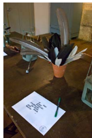
Blick ins Scriptorium im Dom Greifswald

Wir würden uns freuen, wenn Sie die Möglichkeit nutzen, um ihre Universität wieder mal zu besuchen oder sie neu zu entdecken! Die Führung dauert 90 Minuten und kostet 69,00 Euro pro Gruppe. Ermäßigungen gelten für Kinder- und Schülergruppen. Die Führungen können für fünf bis fünfzehn Personen gebucht werden. Einen Informationsflyer erhalten Sie in der Kustodie. Dort können die Führungen auch per E-Mail oder telefonisch gebucht werden.