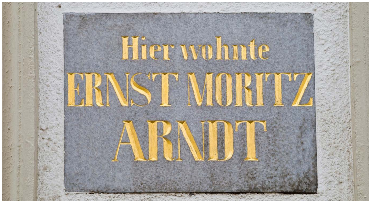
Erinnerungstafel in der Greifswalder Innenstadt