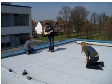
Inspektion auf einem Dach

Regenerative Energie ist umweltfreundlich und sollte sich auch rechnen. Das haben sich Studierende der Universität Greifswald gesagt und der Überlegung Taten folgen lassen. Mitte Mai 2010 gründeten sie den Verein Uni Solar Greifswald .