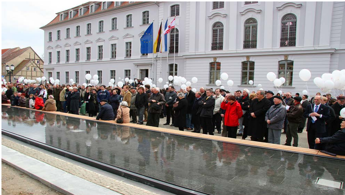
Alumni bei der Übergabe des sanierten Hauptgebäude 2006

Vor einem Jahr wurde der erste Newsletter UNIalumni herausgegeben. Inzwischen haben sich viele Ehemalige als Abonnenten eingetragen. Leider haben wir im Augenblick nicht so viele Mitarbeiter, um den Newsletter öfter herauszugeben.