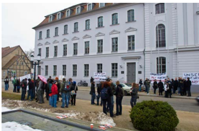
Demonstrationen vor der Senatssitzung am 17. März 2010

Die Zuschauerreihen im Konferenzsaal im Hauptgebäude waren während einer Senatssitzung selten so gefüllt wie Mitte März 2010. Vor dem Gebäude standen sich nach monatelanger und teilweise erbitterter Debatte Befürworter und Gegner des Universitätsnamens gegenüber, getrennt durch die Straße vor dem Hauptgebäude. Mit Plakaten machten sie der anderen Partei deutlich, worum es ihnen geht.