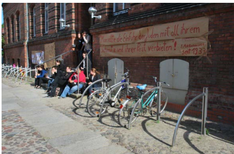
Studierende demonstrierten im Sommer 2009 öffentlichkeitswirksam gegen den Uninamen

Mit 22 Stimmen gegen eine Ablegung des Namens und 14 Stimmen für eine Ablegung sprachen sich beinahe zwei Drittel der Senatsmitglieder für den Namen Ernst Moritz Arndt aus.