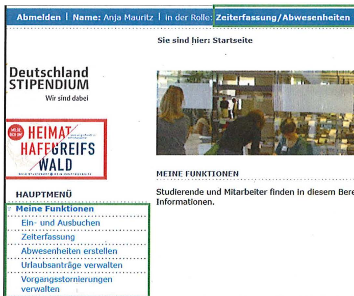
Abbildung 2 Funktionen der Rolle