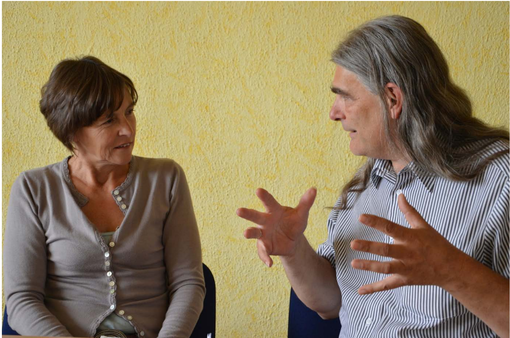
Gesprächsszene aus der Denkwerkstatt Bildung Innovationen „angstfrei“ denken